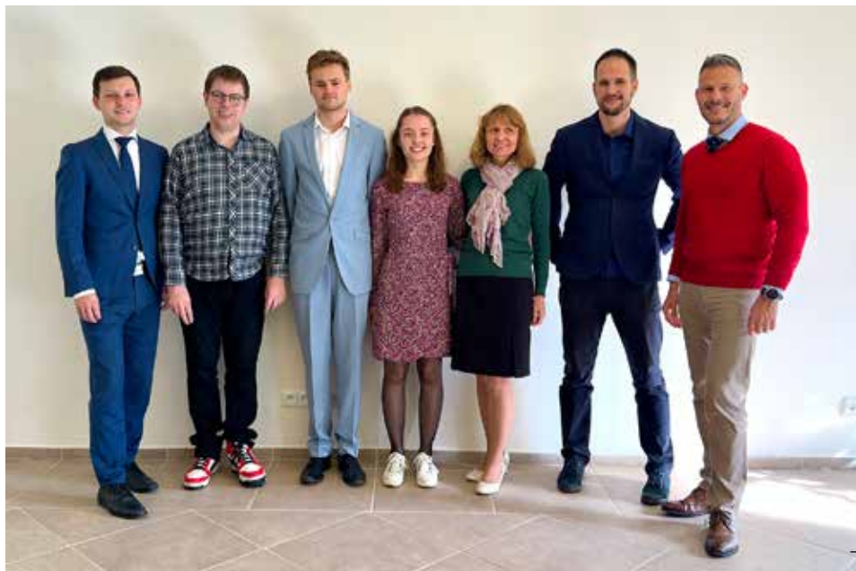
Studenti 3. ročníku

i dovednosti, které by jim umožnily mu lépe sloužit. Jsme Bohu velice vděční za tyto sestry a bratry. Pokud s námi sdělíte tuto vděčnost, můžete se za ně modlit. Studium teologie není jednoduché a nepřítel spasení se bude snažit jim jejich snahu znepříjemnit. Vaše modlitby jim mohou být oporou a pomocí.