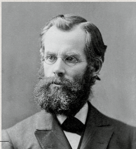
John Nevins Andrews

posílil a povzbudil. Když přijel do Švýcarska, dal do hlavních evropských novin inzeráty tohoto znění: „Hledají se adventisté sedmého dne.“ Lidé překvapivě reagovali a kontaktovali ho. Tak se adventismus postupně šířil v různých evropských zemích, a to hlavně prostřednictvím kolportérů, kteří chodili dům od domu a prodávali Bible a náboženské časopisy, jako například Les Signes des Temps (Znamení doby) . Ve švýcarské Basileji bylo založeno nakladatelství, které vydávalo adventistickou literaturu ve francouzštině, němčině a italštině.