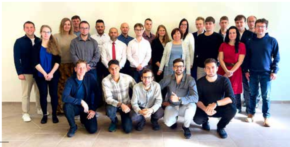
Studenti 1. ročníku

Jsme vděční nejen za počet studentů, ale i za jejich pestrost. Přicházejí ze všech sdružení naší unie: 18 studentů je z Moravskoslezského sdružení, 11 z Českého sdružení a 2 ze Slovenského sdružení; 24 z nich jsou muži a žen je 7. Nejstaršímu je 65 let a nejmladším 20 let. Někteří z nich se považují více za prakticky zaměřené, jiní spíše za studijnější typy. Někteří jsou teologicky více konzervativnější, jiní liberálnější. Pocházejí z různých sborů po celé naší unii a jsou mezi nimi vysokoškolská studentka, podnikatelé, řemeslníci, zaměstnanci, učitelé i jeden lékař.