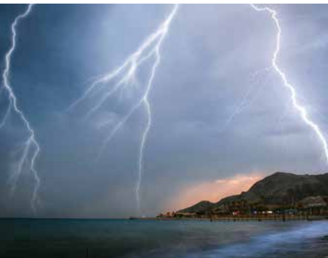
Bouře na Galilejském jezeře

Je to skutečný střet, konflikt mezi Ježíšovými slovy a Petrovým chápáním. Petr na jedné straně ví z předchozí zkušenosti, že Ježíšův příkaz „Zaješ na hlubinu a spusť síť!“ nemá logiku. Na druhé straně si rovněž uvědomuje, že