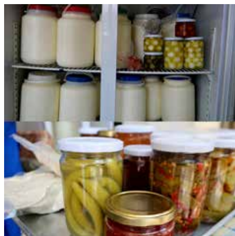
Libanon – podpora soběstačnosti

V důsledku vnitřních i globálních problémů poslední tři roky na Libanon dopadá ekonomická a energetická krize. Země zápasí s nedostatkem pohonných hmot, elektřiny, rostou