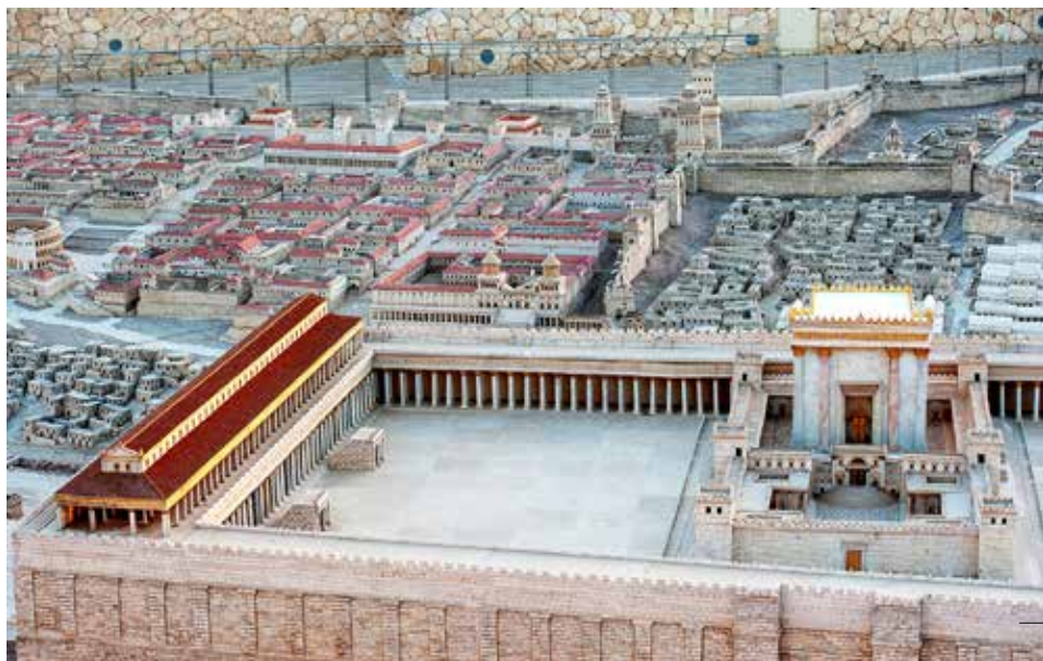
Maketa Jeruzaléma z doby Ježíšova působení

Jak se daří pohanům na náměstí mého srdce?