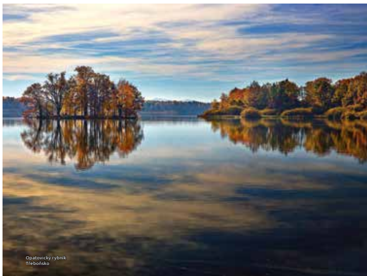
Opátovický rybník Třeboňsko

Pevně se držte Slova života, abych v Kristův den mohl být hrdý, že můj běh a moje námaha nebyly zbytečné.