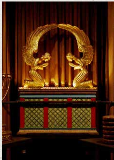
Maketa truhly smlouvy

Dále jsou zde kusy dřeva „ze skutečného Kristova kříže“. Ve čtvrtém století vykonala Helena, matka římského císaře Konstantina, pouť do Svaté země. „Podle legendy tam s rychlostí a jistotou, která může v moderním archeologovi vzbudit jen údiv, objevila pravý