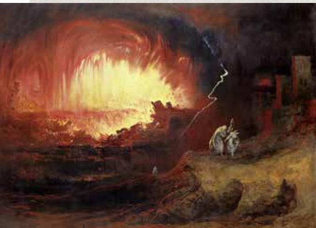
John Martin, Zničení Sodomy a Gomory

povolené vykopávky v Izraeli nebo Jeruzalémě. K provádění vykopávek je třeba mít minimálně bakalářský titul z archeologie, který on navzdory svému tvrzení nemá. Registrujeme jeho tvrzení hraničící s absurditou. Nemají žádný vědecký základ a nikdy nebyla publikována v odborném časopise. Spadají do kategorie nesmyslů, které najdeme v bulvárních novinách, jako je National Enquirer, Sun atd. Je s podivem, že jim někdo věří...“ ( http://www.tentmaker.org/WAR/Zias.html ).