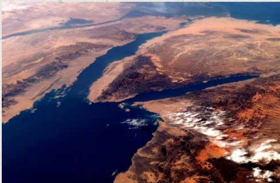
Akabský záliv (vpravo)

budov a pak přežily na volném prostránství po tisíce let, odporuje pochopení základních vědeckých principů (nemluvě o zdravém rozumu).