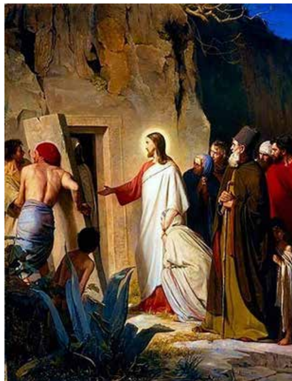
Vzkříšení Lazara od Carla Heinricha Blocha

A tehdy naplníte smysl, ke kterému jsem vás povolal. Tehdy budete skutečným Kristovým společenstvím, smysluplnou církví.