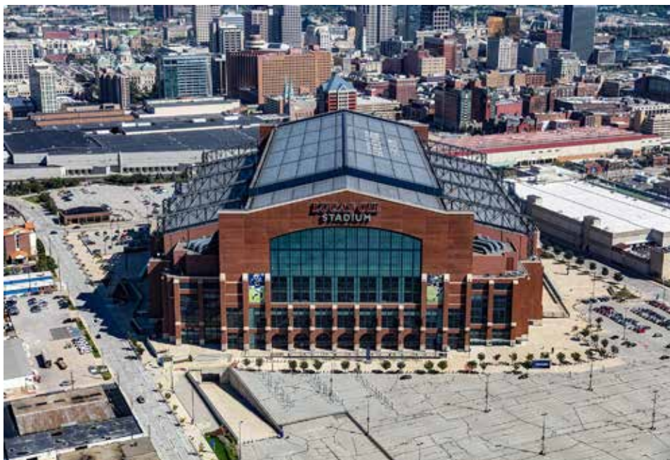
Místo, kde se má konat 63. zasedání GK

St. Louis. Další delegáti se ptali na prostorová omezení a dopad rozdílných nákladů. Jeden delegát se zeptal, zda má výbor pro zasedání Generální konference nějaké doporučení. Výbor odpověděl, že pro 63. zasedání Generální konference jednomyslně doporučuje Indianapolis v Indianě, a to z několika důvodů.