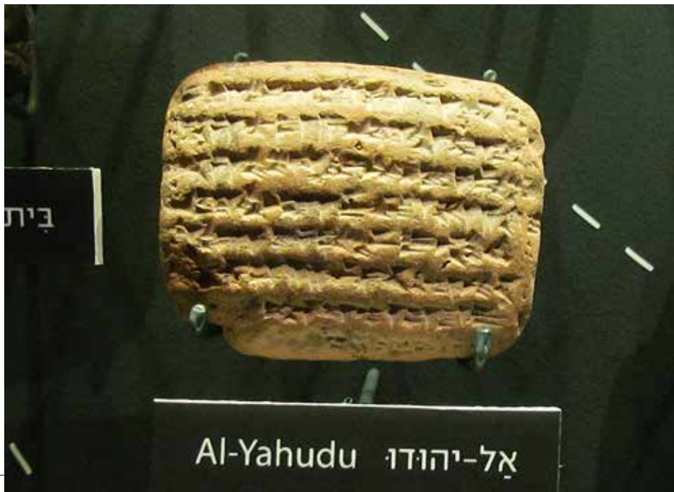
Jedna z babylónských tabulek

Jiní poukazovali na to, že žádná tabulka se nezmiňuje o návratu Židů do vlasti. „Opět,“ řekl Heath-Whyte, „to není něco, co by Babylóňané nutně