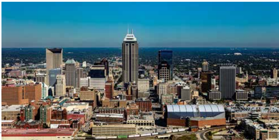
Město Indianapolis ve státě Indiana

Členové výboru GC-EXCOM vznesli otázky ohledně bezpečnosti v městě