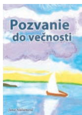
Strán: 108; cena: 5 €