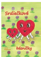
Strán: 40; cena: 4 €

Sestry a bratia, drahí priatelia, pretože súčasťou našich bohoslužieb je okrem hovoreného slova aj hudba, pieseň či poézia a keďže v poslednej spomínanej oblasti máme nedostatok materiálov, odporúčame vám tri zbierky básní. Básne na Božiu oslavu, poetické zamyslenia o Božej láske, pravde, pomoci, nádeji, na úžitok a povzbudenie nielen pre Boží ľud, ale aj pre ľudí vo svete, aby sa chceli navrátiť