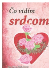
Strán: 112; cena: 5 €

Na spoločné stretnutie sa teší Aleš Zástěra, koordinátor